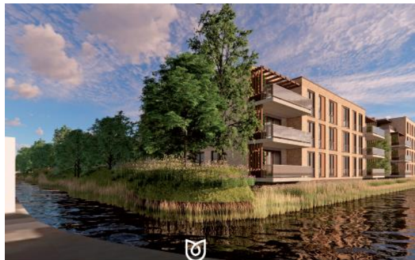
Aan deze afbeeldingen / impressies kunnen geen rechten worden ontleend.